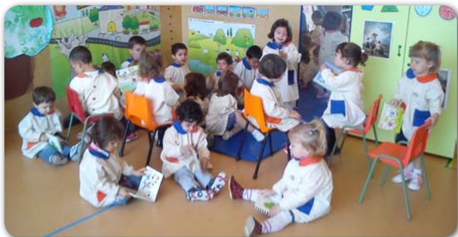
En los meses de calor no llevan bata

Nos hemos dado cuenta que elegir el menú para nuestros hijos/as, nos resulta dificultoso, de modo que será obligatorio que todos los niños/as lleven el mismo menú todos los días de la semana. Siempre y cuando por edad el pediatra ya haya introducido todos los alimentos. De esta forma evitaremos que a un niño o niña le apetezca el menú de su compañera/o, además de no tener que pensar en qué hacerles para comer.